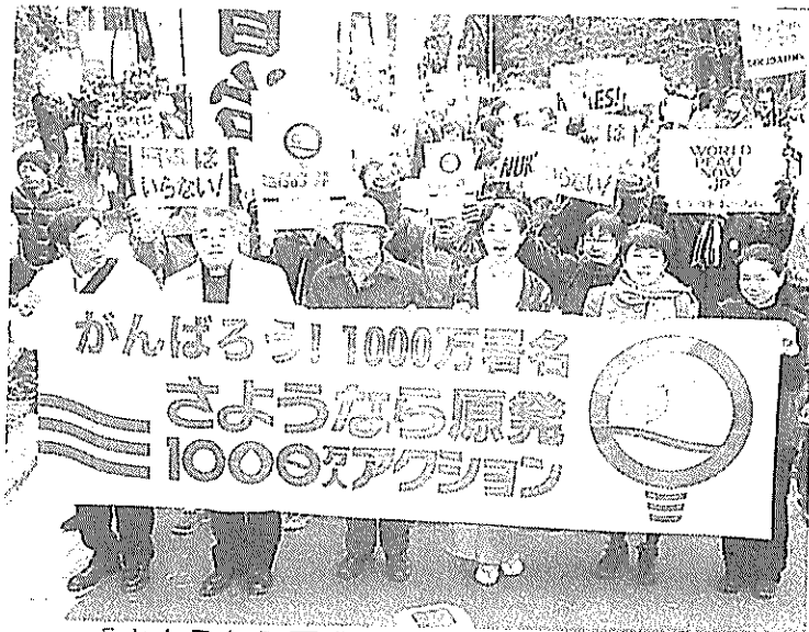
「さようなら原発」集会後にデモ行進する参加者＝10日午後、東京・日比谷公園で